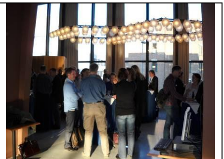
De afsluitende borrel