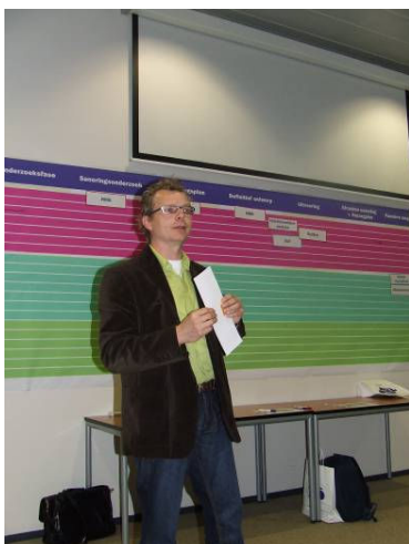
Een rooskleurige blik op ROSA door Hans Slenders