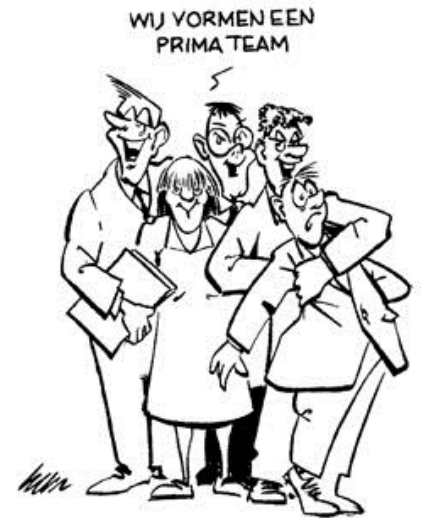
Deze cartoon komt uit "GROEIEN EN STAPELEN" © Ardis Management Development