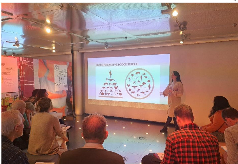
Figuur 3 Foto van de workshop over bodemstewardship tijdens Wereldbodemdag 2024.

De tweede workshop ging over het concept van een bodemsteward. De deelnemers werden eerst gevraagd om individueel na te denken over wat een bodemsteward is, door een figuur op een