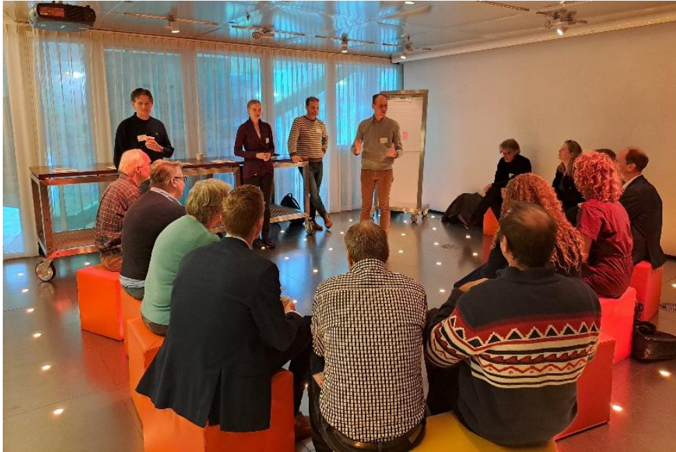
Figuur 2 Foto van de bodemanifesten workshop tijdens Wereldbodemdag 2024.

Het algemene beeld wat hieruit volgt is dat concrete acties uit manifesten vaak als positief punt worden gezien, met de kanttekening dat het hierbij ook belangrijk is van wie de boodschap komt. Wat niet goed wordt ontvangen zijn algemene kreten waaruit geen acties af te leiden zijn. Daarnaast werd